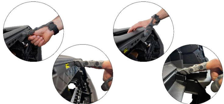
Pulsar dirección 2